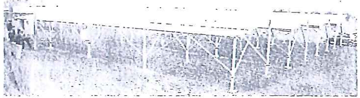
耕作放棄地に設置された「ソーラーシェアリング」の設備。パネルの下でサカキの苗が育つ(美里町で)

今回実験が始まった同町広木の土地はブルーベリーを栽培していたが、土地との相性が悪く、昨年から耕作放棄地となっていた。地権者らは農業生産法人を5月にも設立し、農作業を請け負う。事業を運営する一般社団法人「メガソーラー機構」(東京都港区)は、草刈りや苗の購入にかかる経費のほか、地権者に1平方メートルあたり年間1000円の賃貸料を支払う。地権者の希望があれば、発電設備は事業が終わった後に無償で譲渡するという。